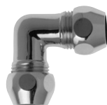
516 38 08 Porca curva de ligação em metal polido 3/8"x 3/8" - 8 mm 516 38 10 Porca curva de ligação em metal polido 3/8"x 3/8" - 10 mm 516 38 12 Porca curva de ligação em metal polido 3/8"x 3/8" - 12 mm