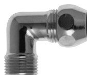
512 12 10 Porca curva de ligação em metal polido 1/2" x 1/2" - 10 mm 512 12 12 Porca curva de ligação em metal polido 1/2" x 1/2" - 12 mm