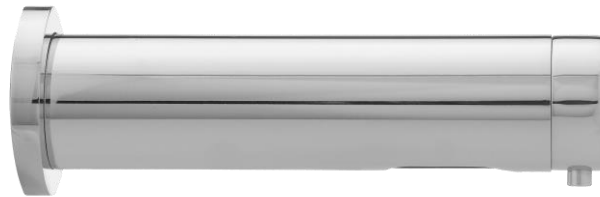
Dispensador de sabão